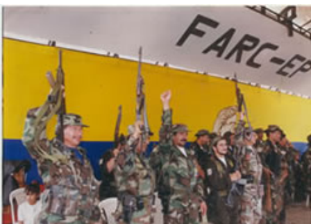
Командири ФАРК під час мирного процесу в Кагуані (22 березня 2022)

Внутрішній збройний конфлікт у Колумбії розпочався в 1964 році внаслідок протистояння між урядовими силами, з одного боку, та недержавними військовими формуваннями: ультраправими воєнізованими групами, ультралівими партизанськими об'єднаннями і злочинними наркосиндикатами, які змагалися за владу та захист власних інтересів у Колумбії, з другого. На різних етапах конфлікту склад тих, хто протистояв урядові, змінювався, але в абсолютній більшості епізодів конфлікт носив внутрішній характер.