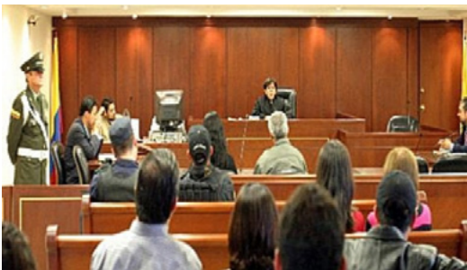
Слухання у справі про відшкодування збитків (липень 2009)

У ході своєї діяльності НКВП розробила визначення, принципи та критерії дій із відшкодування збитків жертвам. Тут доречно згадати про два ключових досягнення: 1) пропагування концепції інтегрального (всеохопного) відшкодування та 2) встановлення принципів і критеріїв відшкодування відповідно до обставин колумбійської війни.