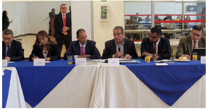
Міністерство оборони Колумбії як контролюючий органи Національної системи допомоги та відшкодування збитків жертвам відзначив успіхи Відділу допомоги та комплексного відшкодування жертвам

Директора Відділу призначав на посаду та звільняв з посади президент, а структуру та персональний склад мав визначати національний уряд. Бюджет Відділу мав формуватися за рахунок внесків із загального бюджету країни, активів злочинців, переданих іншими державними установами.