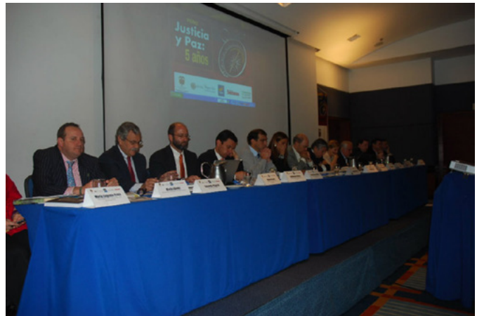
Представники всіх органів влади, відповідальних за імплементацію закону “Про справедливість і мир”, зустрілися, щоб обговорити його переваги та виклики. (серпень 2010)

У 2005 році відшкодуванням жертвам конфлікту зайнявся колумбійський уряд, який розробив та, після прийняття парламентом, впровадив Закон “Про справедливість і мир” (975/2005) (ісп. Ley de Justicia y Paz). Ним у Колумбії було закладено основи перехідного правосуддя та юридичні рамки для визнання і забезпечення права жертв на правду, справедливість і відшкодування збитків. Цей закон визнав право жертв на участь у всіх стадіях кримінального процесу проти членів незаконних угруповань, відповідальних за тяжкі злочини. Крім того, він передбачав можливість полегшувати покарання винуватцям злочинів за умови, що вони сприятимуть правосуддю. Таке сприяння могло полягати у щирому зізнанні в скоєних злочинних діях, поверненні всього майна та активів, отриманих у незаконних збройних формуваннях, на користь жертв, а також в участі в інших формах відшкодування потерпілим.