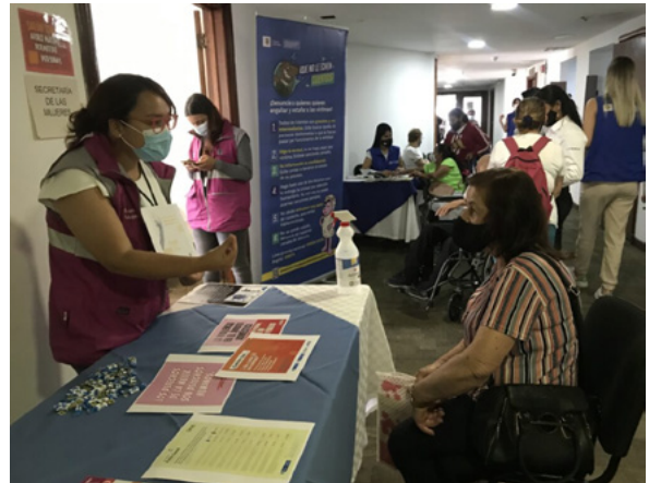
Лекції для бенефіціарів з Медельїні, Колумбія стосовно інвестування відшкодованих коштів (серпень 2022)

Процес реституції складається з двох етапів. На адміністративному етапі заявники повинні подати свої вимоги для оцінки державним органом при Міністерстві сільського господарства - Відділом реституції земель (ісп. Unidad de Restitucion de Tierras). Метою є реєстрація майна у земельному кадастрі на випадок позбавлення права власності чи примусового залишення. Тільки після того, як власність зареєстрована, заявник може перейти до судового етапу. На судовому етапі суддя або магістрат з питань реституції землі виносить рішення за позовом. Механізм, що включає як адміністративні, так і судові елементи, покликаний примирити конфліктуючі інтереси учасників процесу. Мета цієї гібридної системи - забезпечити ефективність, узгодженість і своєчасність