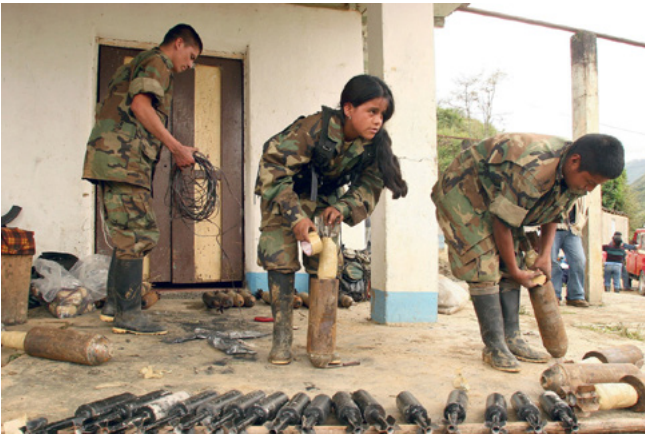
Неповнолітні члени ФАРК (2020)

були передані урядові для здійснення відшкодувань, і неефективні спроби забезпечити колективне відшкодування, стабільності в процесі відшкодування збитків не було. Крім того, Закон 2005 року та Указ 2008-го не враховували низку категорій жертв, зокрема не були належно адресовані права постраждалих від сексуального насильства, примусової мобілізації та інших. Нормативні документи згадували ці види злочинів, однак спеціалізованої процедури, яка б гарантувала їхнім жертвам справедливе відшкодування не було передбачено.