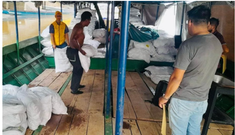
Роздача гуманітарної допомоги у муніципалітеті Солано, департамент Какете (квітень 2024)

Відповідно до ст.ст. 151 і 152 цього закону, під колективне відшкодування підпадала шкода, спричинена порушенням колективних прав, серйозним і явним порушенням індивідуальних або колективних прав членів групи, а також широким впливом порушення прав окремих осіб. Документ передбачав поетапний підхід до групових компенсацій.