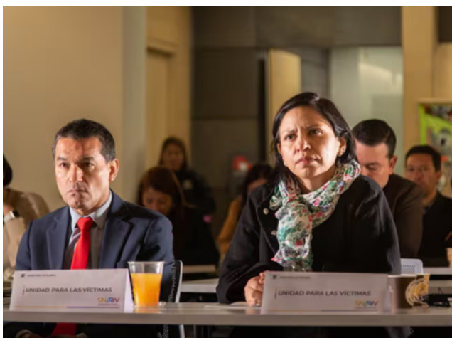
Засідання Національної системи допомоги та відшкодування збитків жертвам (березень 2023) Джерело: Sistema Nacional de Atención y Reparación Integral a las Víctimas

Було визначено, що Система має дві інстанції на національному рівні: Виконавчий комітет з питань допомоги та відшкодування і Спеціальний адміністративний підрозділ з питань допомоги та відшкодування. Виконавчий комітет розробляє та ухвалює державну політику щодо компенсацій. Спеціальний адміністративний підрозділ має координувати її виконання. Для імплементації цієї політики на місцевому рівні створювалися Територіальні комітети