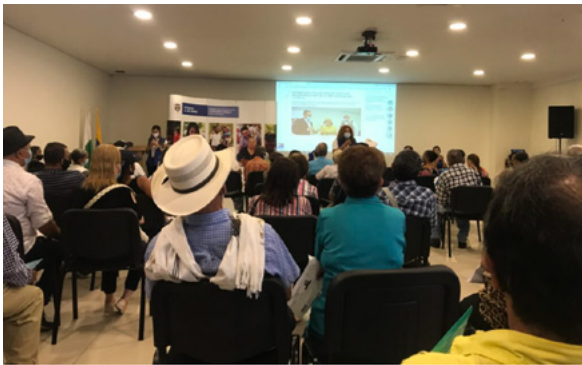
Зустріч Відділу допомоги та комплексного відшкодування жертвам, на якому жертвам повідомляють, що вони отримають виплати відшкодування (серпень 2022)