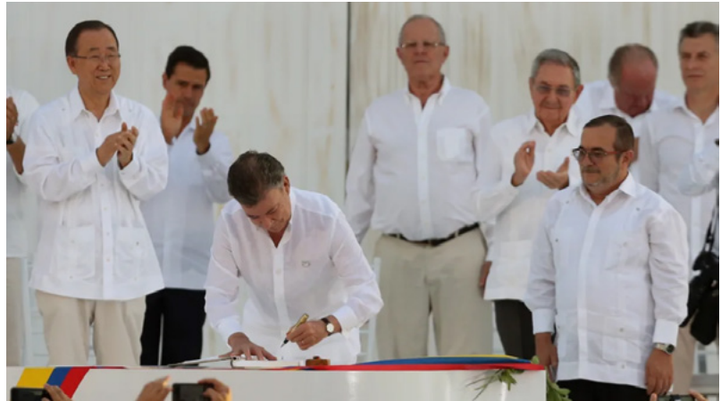
Президент Колумбії Хуан Мануель Сантос підписує мирну угоду між урядом Колумбії і ФАРК (представник ФАРК Родріго Лондоно - справа), яка покладе край більш ніж 50-річному конфлікту, в Картахені, Колумбія, (26 вересня 2016)

Конфлікт тривав понад 50 років, кількість жертв сягнула 200 тисяч, і тоді врешті уряд і ФАРК досягли домовленостей, які офіційно поклали край війні. Остаточна угода була підписана у вересні 2016 року і передбачала, з-поміж іншого, створення Комплексної системи встановлення істини, правосуддя, відшкодування збитків і недопущення повторення конфлікту (ісп. Sistema Integral de Verdad, Justicia, Reparación y No Repetición). За рішенням сторін угоду винесли на всенародний референдум з метою підтвердити політичну угоду народним волевиявленням у жовтні