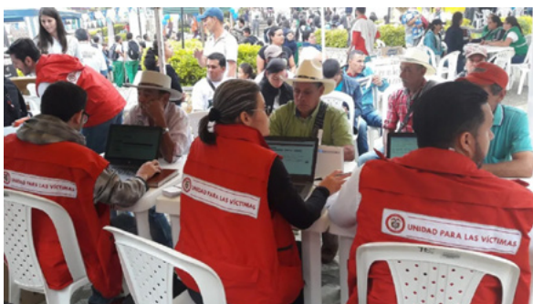
Реєстрація заяв до Реєстру потерпілих (червень 2018)

Реєстр переміщеного населення, яким займалося Агентство соціальних дій та міжнародного співробітництва при Президентові Колумбії, був доповнений Реєстром потерпілих. Закон 1448 передбачав, що обидва реєстри переходили у відання Спеціального адміністративного підрозділу з питань комплексної уваги та відшкодування шкоди потерпілим. Створення реєстру мало наслідком виділення окремої статті витрат у державному бюджеті Колумбії для репараційних виплат.