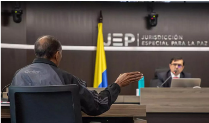
Старший секретар суду вислуховує потерпілого, який розпитує колишнього військового про позасудову страту свого сина (2024)

Труднощі в координації між державними органами та установами, обмежені можливості держави, бюрократичні проблеми – загальні проблеми державного управління в Колумбії – призвели до того, що компенсаційні механізми в країні не виправдали сподівань потерпілих. Так, через сім років після ухвалення Закону 1448/2011 і за три роки до закінчення терміну його дії, лише близько 7% жертв, внесених до Єдиного реєстру жертв, отримали компенсації. Компенсації отримали 2,7% зареєстрованих жертв примусового переміщення, 33% жертв насильницьких зникнень і 30,5% жертв убивств. Більшість із них отримали компенсації в результаті застосування Указу 1290/2008, через адміністративну процедуру.